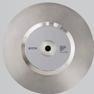
DWF-200 DIAMOND WHEEL FINE Korrel 600

← Snelle staalverwijdering bij het herstellen van beschadigde messen.