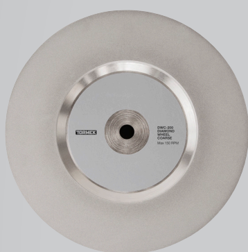
DWC-200 DIAMOND WHEEL COARSE Korrel 360

De Tormek T-2 Pro Kitchen Knife Sharpener kan niet alleen gebruikt worden voor uw dagelijkse slijpbehoeften, maar ook voor het herstellen van beschadigde messen of als u die extra gepolijste afwerking wenst. Het combineren van verschillende diamantslijpwieLEN kan uw slijpen sneller en meer geschikt maken voor uw specifieke behoeften.